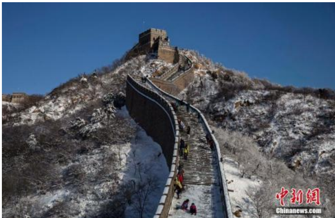
资料图：银装素裹的长城。

中新网北京1月21日电 昨夜今晨，北京姗姗来迟的初雪再度被舆论聚焦。不少北京城区的市民抱怨未见气象预报中的“全市性降雪”，不过，北京市气象局今晨发布消息称，昨夜开始，北京出现入冬以来首场较大范围降雪天气，全市多于10个人工站点观测到有降雪现象，已达初雪标准。